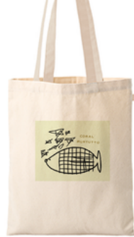
② コーラル・フィッシュ