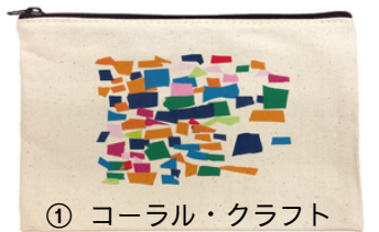
① コーラル・クラフト