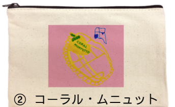
② コーラル・ムニュット