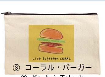
③ コーラル・バーガー © Kouhei Takeda