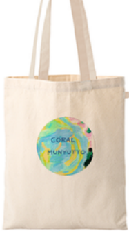
① コーラル・アース © Seiki Kusumoto