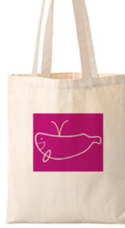
③ コーラル・ホエール